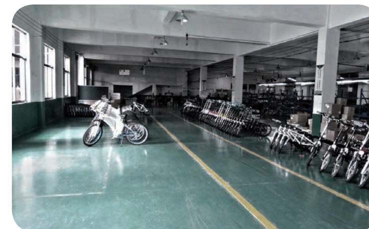
SOUČÁSTÍ LINKY JE I TESTOVACÍ DRÁHA