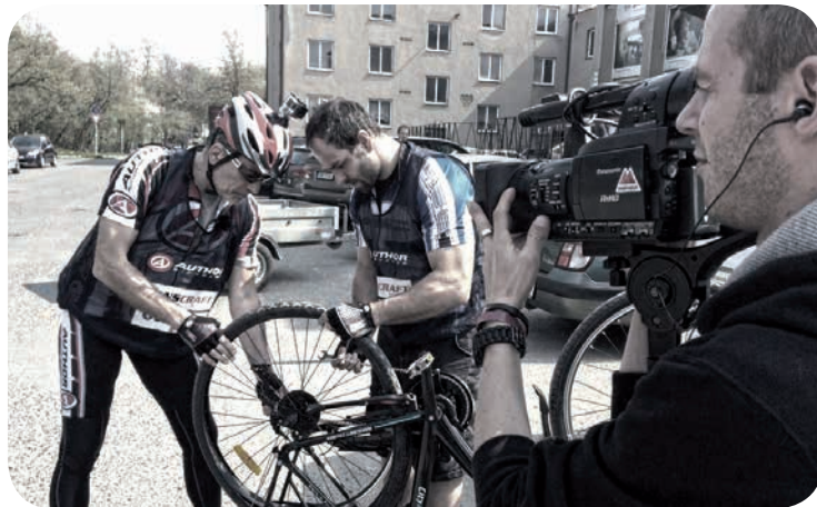
NATÁČENÍ TV METROPOL BĚHEM POŘADU PRAŽSKÉ CYKLOSTEZKY