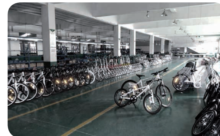
EXPEDICE NAŠICH ELEKTROKOL