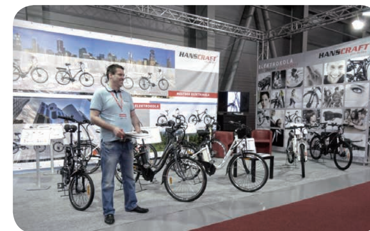
KAŽDOROČNÍ STÁNEK NA VELETRHU FOR BIKES

rám: aluminium - 6061.T6 velikost rámu: 48 cm kola: 26" přední, 24" zadní s odrazkou ráfky: 26" a 24" dvoustěnné, CNC side wall, 6061.T6 výplet: 13g ocelový přední brzda: čelistřivá (V-brake) - Tektro zadní brzda: protišlapná brzda přední vidlice: odpružená - ZOOM řídítka: hliníková - ZOOM představec: hliníkový, polohovatelný - ZOOM hlavové složení: NECO PARTS brzdové páčky: hliníkové - snímač odpojení el. pohonu řazení: SHIMANO NEXUS - 3 rychlostní - systém Revoshift měnič: SHIMANO NEXUS INNER - vnitřní 3 rychlostní řetěz: rezuvzdorný, 1/2 x 3/32 - 120 řetězové kolo: 44T, aluminium - slišina sedlovka: odpružená; hliníková s upínacím systémem Promax sedlo: městský styl - GS osvětlení: LED přední a zadní - Spanninga, zapínání King Meter blatníky: ABS plast s gumovou zástěrkou pláště, duše: CST gripy: VELO